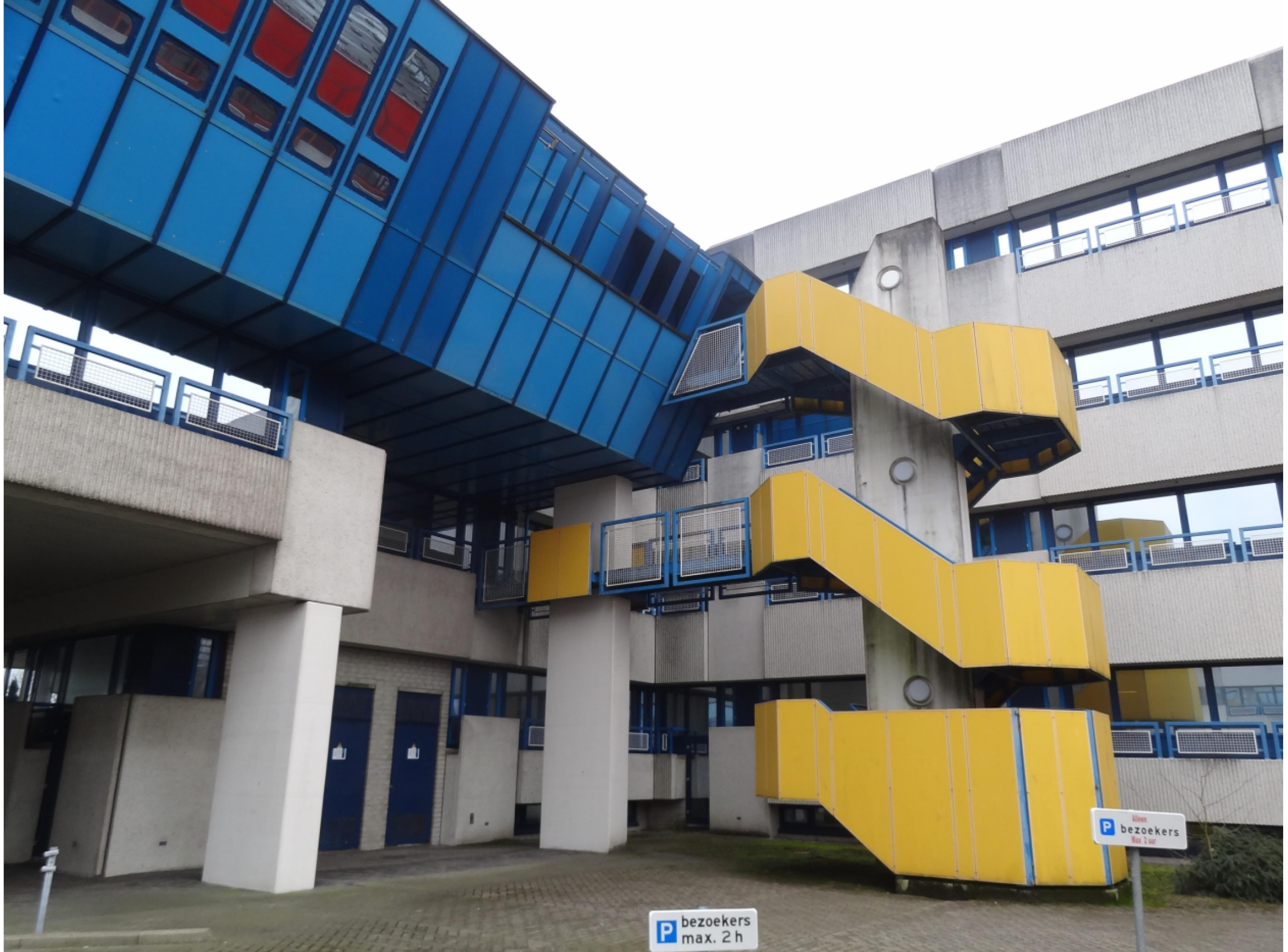
bestaande gevelpuien, prefab elementen, hekwerken en vluchttrap slopen.