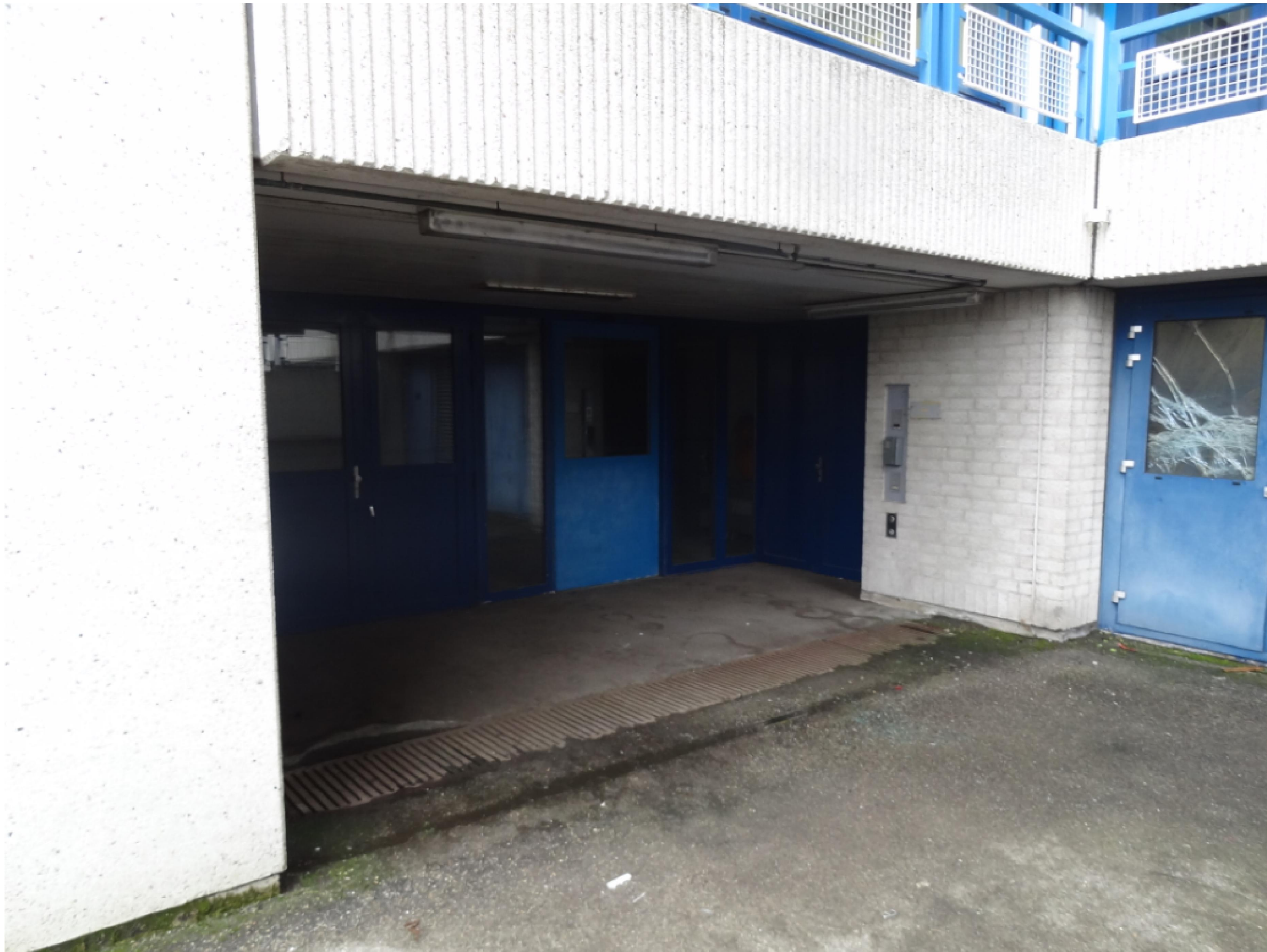
Onderzijde bestaande hellingbaan. Bestaande toegangspui slopen. Nieuwe wand plaatsen voor bestaande pui uiteinde hellingbaan.