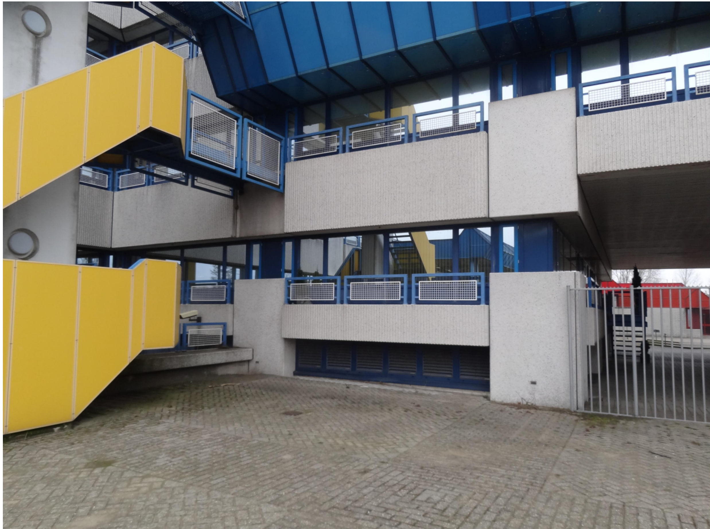
bestaande gevelpuien, prefab elementen, hekwerken en vluchttrap slopen.