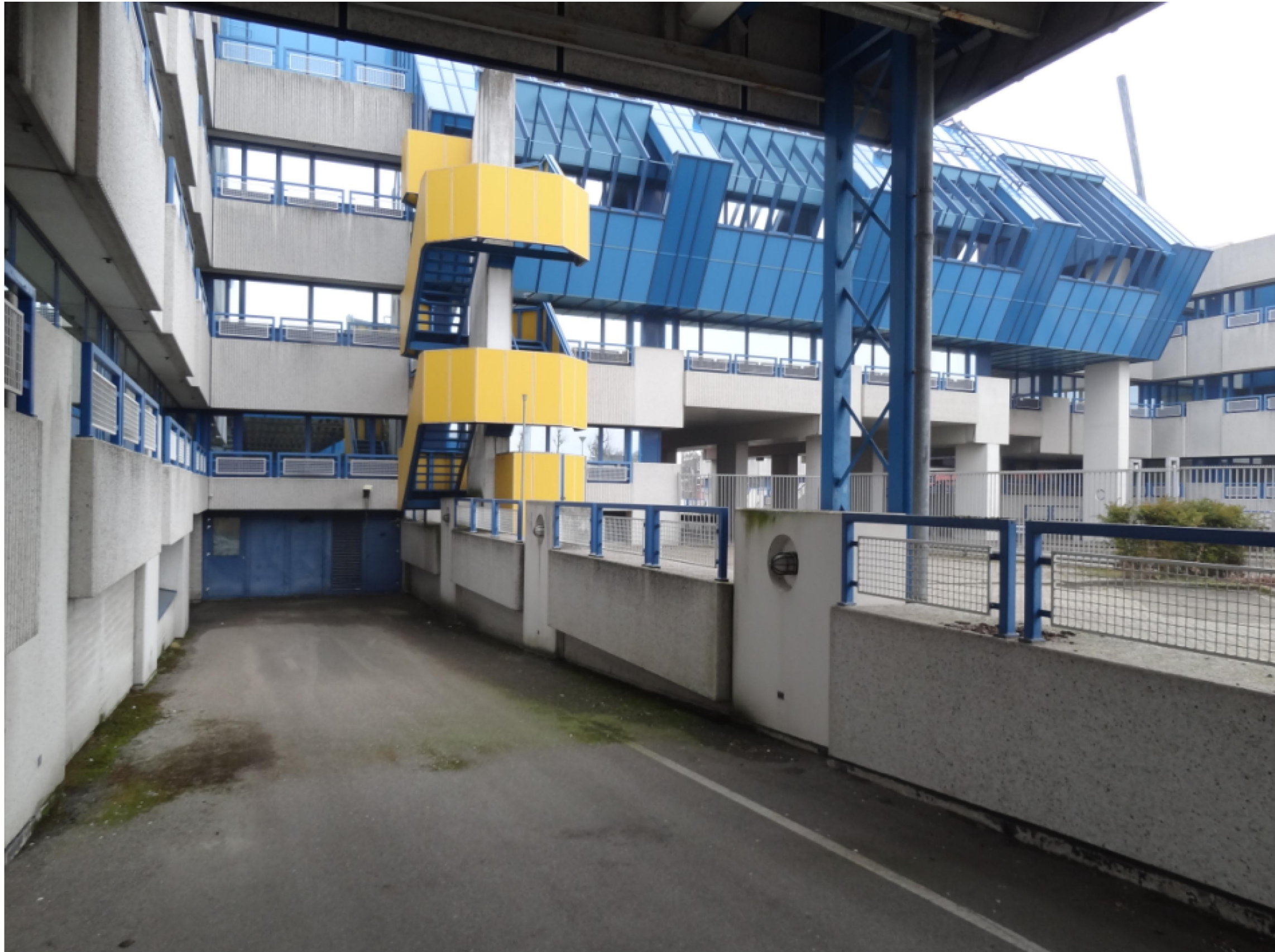
Bestaande hellingbaan. Prefab elementen en hekwerken langs hellingbaan verwijderen.